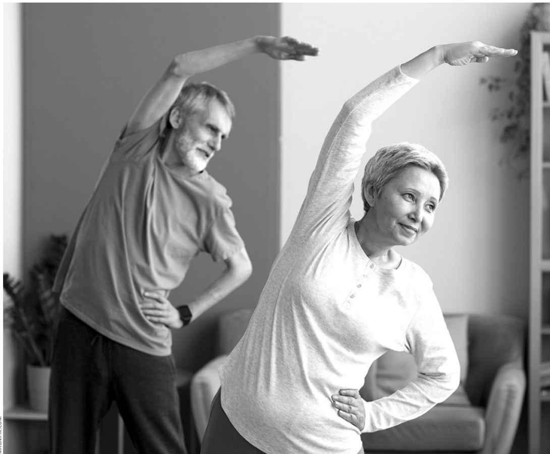
Активность — путь к долголетию

По данным ВОЗ, до 60% преждевременных смертей напрямую связаны с управляемыми факторами риска. Это означает важную вещь: здоровье во многом зависит от ежедневных привычек.