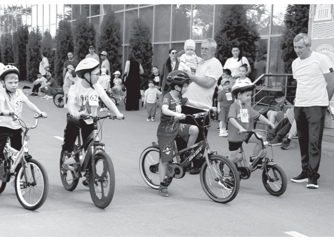
Юные велосипедисты на старте