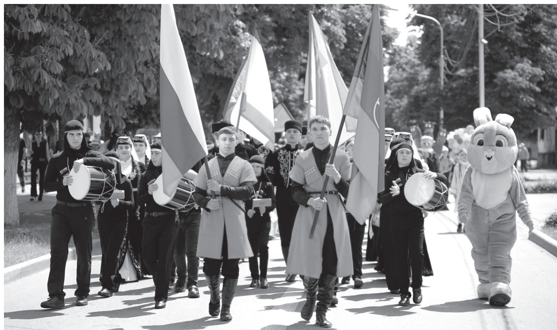
Шествие участников фестиваля «Зори Кавказа» на Зеленый остров

В Карачаево-Черкесии прошел Северо-Кавказский фестиваль детского художественного творчества «Зори Кавказа»