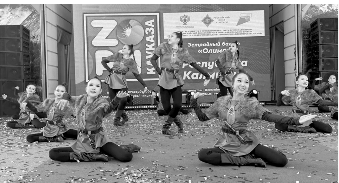
Каждый коллектив своим выступлением дарил море позитива

— Мы стремимся показать на этом фестивале всю красоту и самобытность нашей малой родины, — с энтузиазмом продолжала Татьяна Вячеславовна. — Наше выступление — это яркое отражение культуры нашего региона. В каждый танец мы вкладываем душу, эмоции, стараемся донести до зрителя ту радость и гордость, которую испытываем